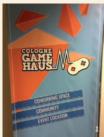
Game Haus (1, 2, 3) tentoonstelling SHINE (4, 5)